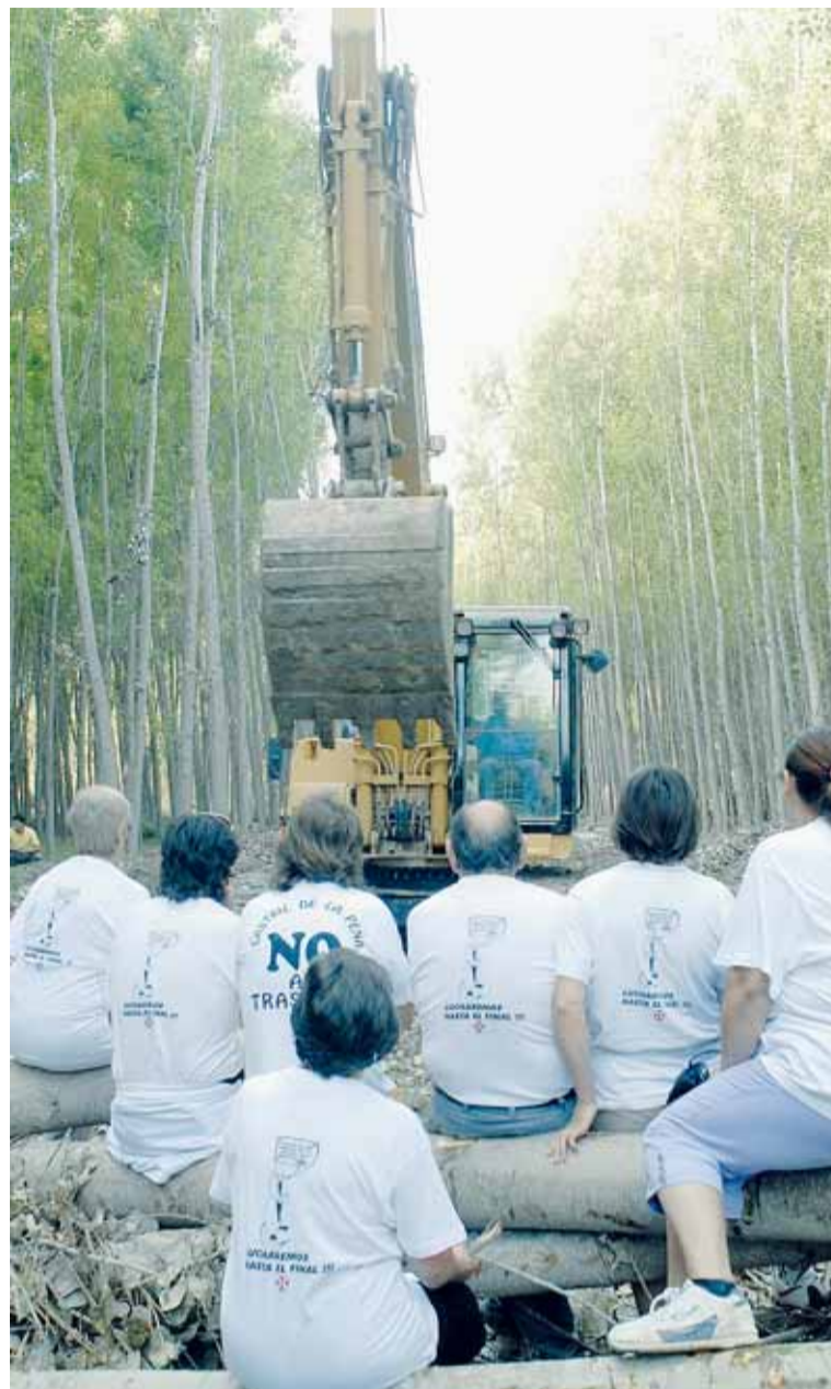
Miembros de la Plataforma hacen frente a las máquinas.

La Guardia Civil continuará de momento en la zona para proteger las obras e impedir daños en la maquinaria.